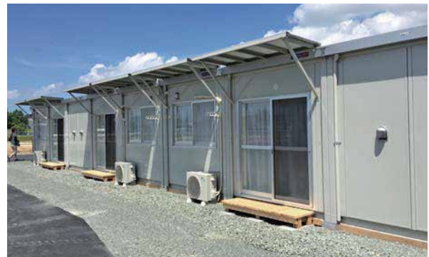
(仮称)光の森多目的広場に建設された仮設住宅。