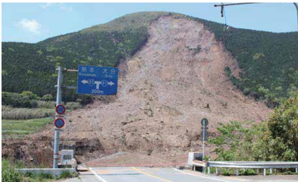
崩落した阿蘇大橋。

過去に例を見ない災害です。復旧・復興も一人では何もできません。みなさん、一緒になって乗り越えていきましょう！