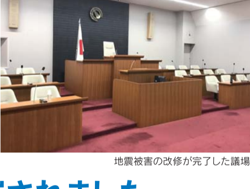
地震被害の改修が完了した議場

平成29年度一般会計補正予算。歳入歳出それぞれ10億2496万5千円を追加。歳入歳出の総額はそれぞれ157億2421万1千円。歳出予算に不足が生じたものや、菊陽町総合交流ターミナル「さんふれあ」の改修費の一部、約1億4000万円（全体計画は4億円程度）や集会所2ヶ所の建築工事費等、約8300万円等、熊本地震に伴う災害復旧関係費などの支出増加によるもの。賛成多数で可決されました。