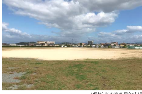
（仮称）光の森多目的広場

また、これまで議会において用途についての質問だけでなく様々な提案もあつているにもかかわらず、何ら説明もないまま、町は多目的広場の利用計画を決定しました。今後はどのような経緯で決定したのか、また町民の意見集約等の機会はないのか等、今後しっかりと町へ質問していきます。