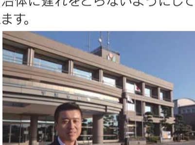
宇城市役所を視察研修

このように事例等を話しながら、町へ導入の要望をし、町としては「検討する」という答弁でした。