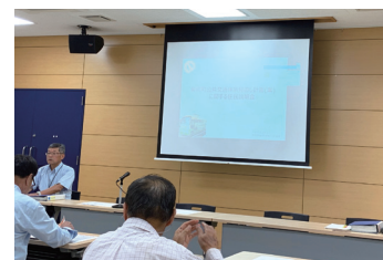
住民説明会の様子