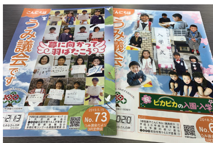
宇美町議会広報誌

また、有田町議会ではICTの導入を進めており、全議員がタブレットを使用しペーパーレス化に取り組んでいるとのこと、ICT化への取り組みが進んでいました。