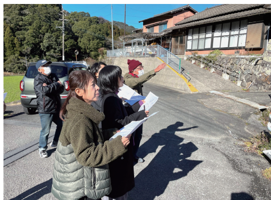
風力発電計画地視察の様子

風力発電計画地視察では、地域住民の方が調べた計画の概要についてお聞きしました。30基の風力発電機の設置が予定されているとのこと、設置の工事においても周辺住民への影響が大きく、また工事内容や将来の撤去時の費用負担がどうなるのかなど、さまざま問題があると思いました。これは水俣の風力発電だけでなく、全国で進んでいる再生可能エネルギー施設（風力発電・太陽光発電等）は本当に環境にやさしいのかということを検証しなければならないのではないかと思います。