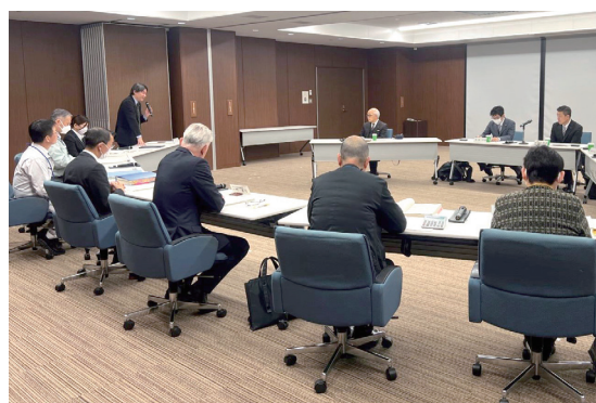
佐伯市での研修の様子

どちらも、行政側からの説明をお聞きした後に質疑応答という進行でしたが、活発な質疑応答があり、これからの菊陽町での取り組みに対しても大変参考になりました。